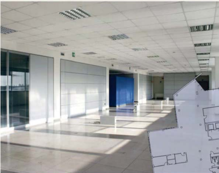
Piano Primo/First floor